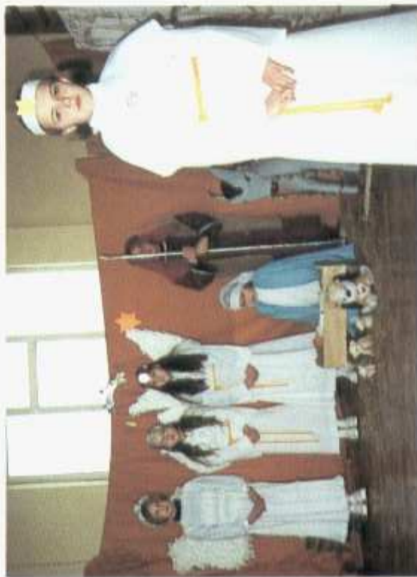
Jaselka szkolne L. Wierzbinska