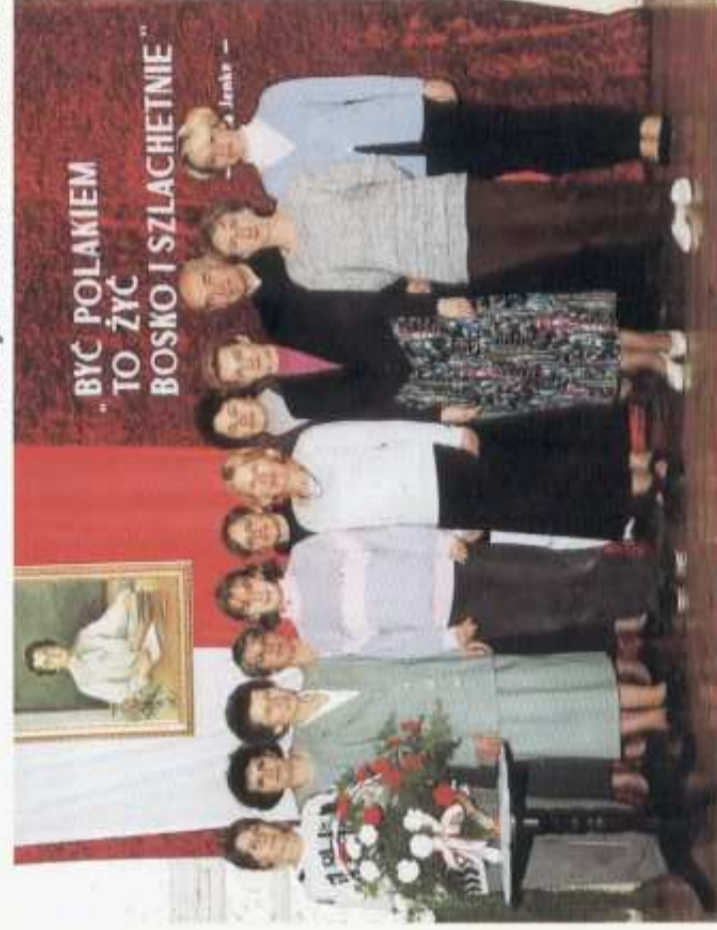
Grono Pedagogiczne Zespołu Szkół

„Bo na wieki być Polakiem, to żyć bosko i szlachetnie”.