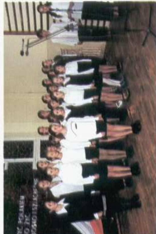
Uroczystość Nadania Imienia