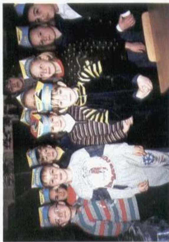
W bibliotece szkolnej pasowanie na czytelnika