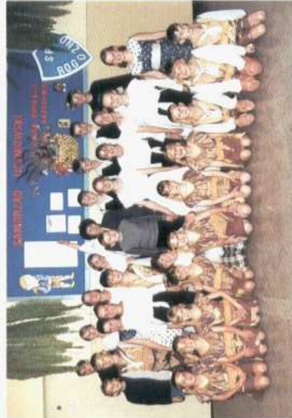
Zespół Taneczny „Blik”, choreograf: Świętłana Antoni

Szkoła w Rogóźnie od zarania swoich dziejów rozwijała się dynamicznie. Na przestrzeni lat można dostrzec ofiarną społeczność, które zawsze przychodziło szkole z pomocą.