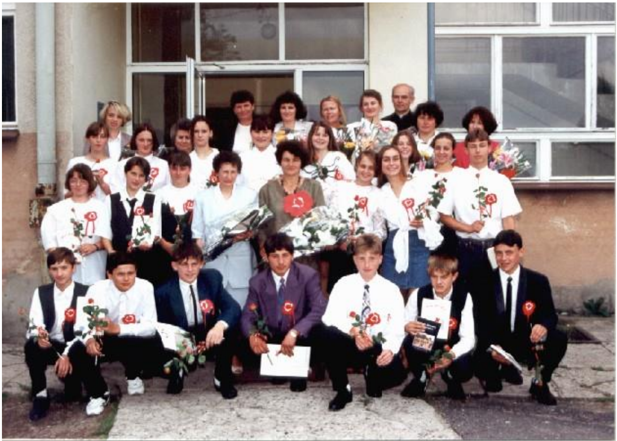
Ośmioklasiści z Gronem Pedagogicznym, 16 VI 1996 r.