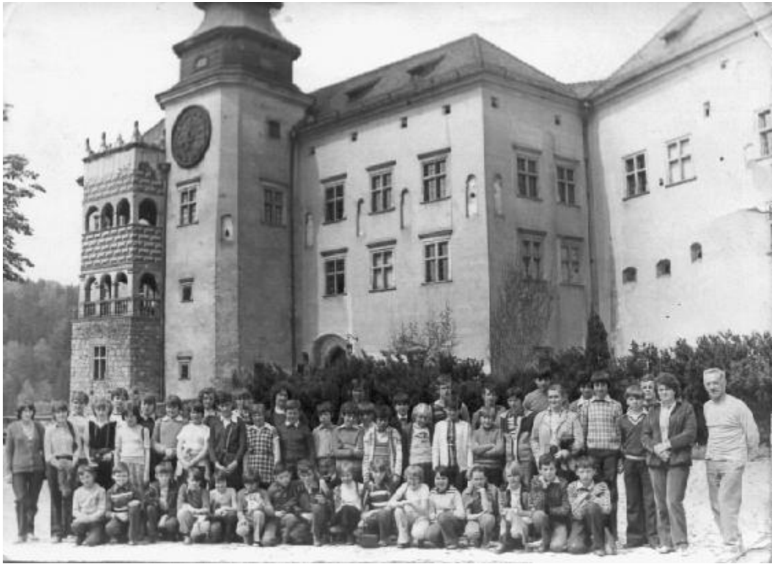
Wycieczka do Ojcowa w 1981 roku.