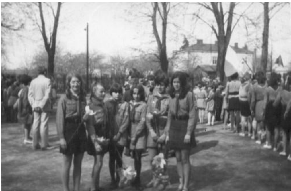
Pochód pierwszomajowy w 1970 roku