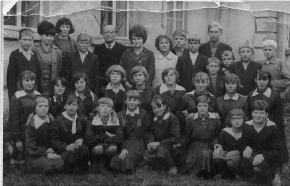
Uczniowie klasy VII z gronem pedagogicznym