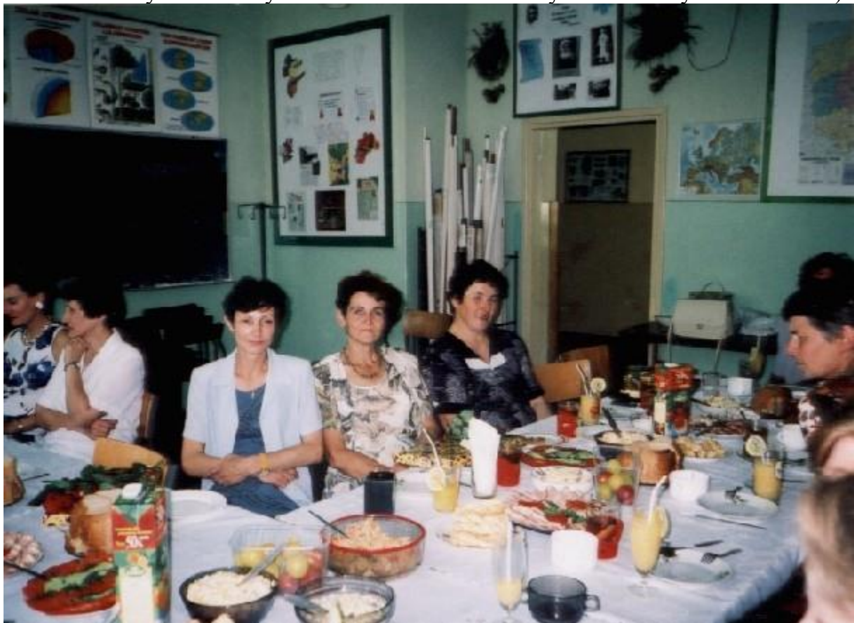
Pożegnanie Nauczycieli-Seniorów, 20 VI 2000 r.