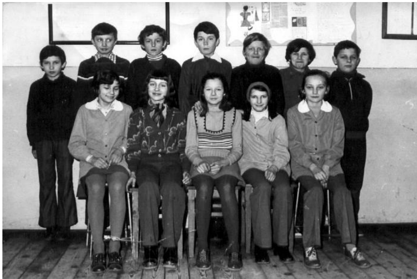
Uczniowie klasy VI w 1978 roku