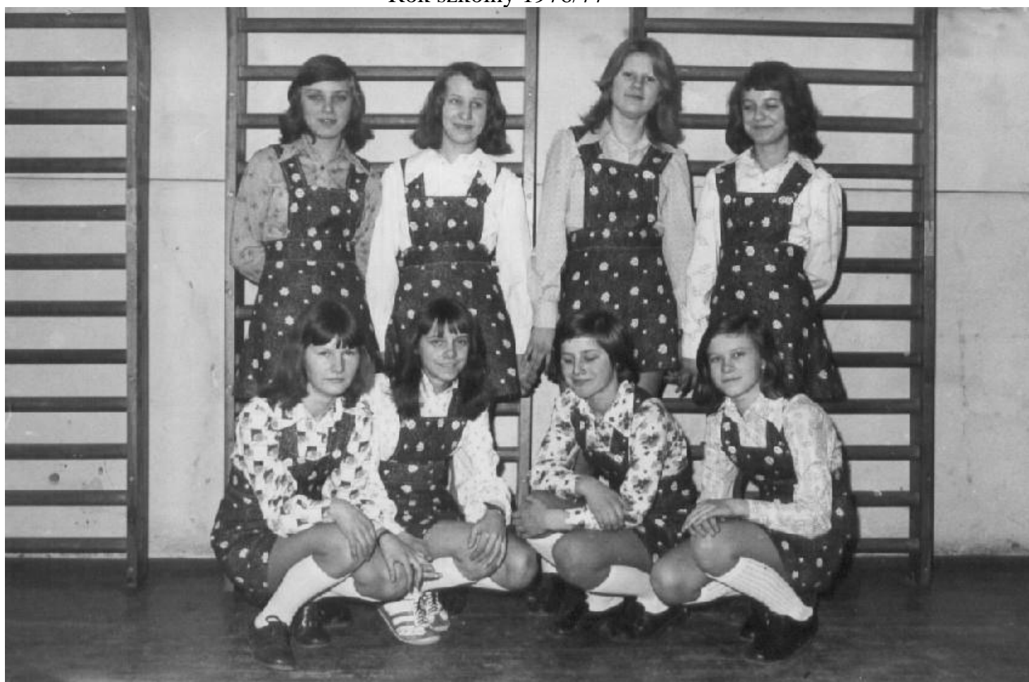
Zespół taneczny w 1977 roku