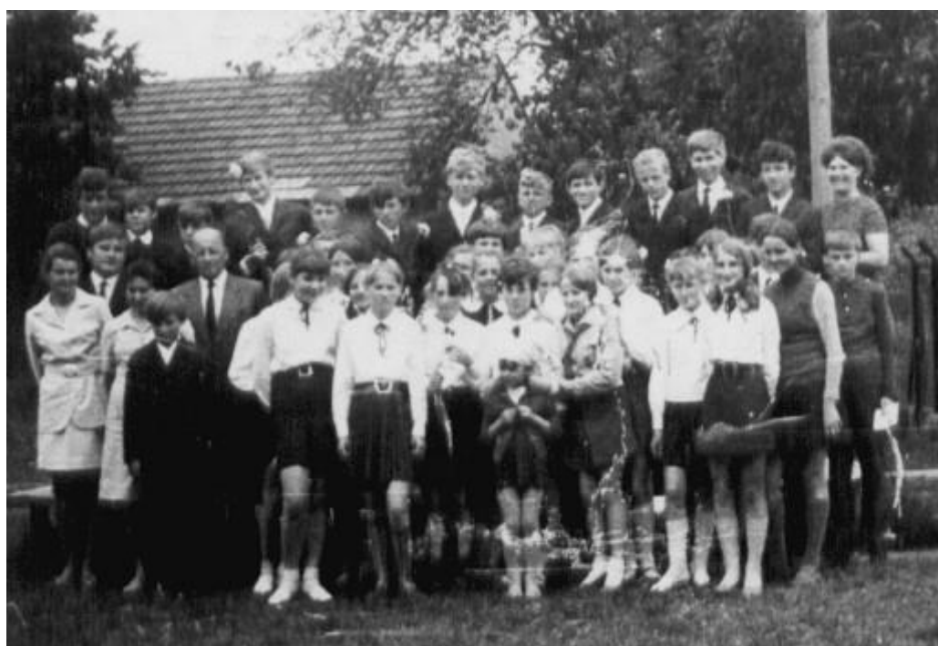
Pożegnanie klasy VIII w 1970 roku