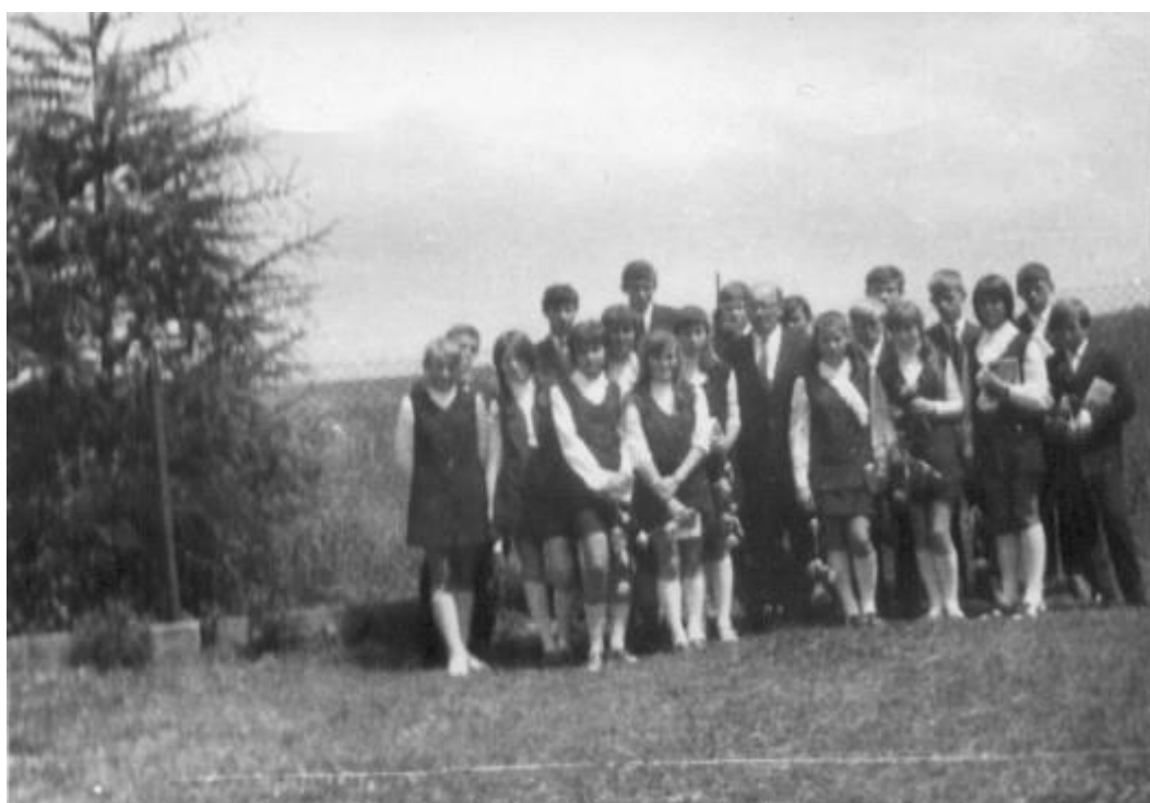
Pożegnanie klasy VIII w 1972 roku