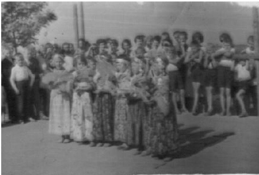
Taniec cygański w wykonaniu dzieci z klasy I i II w 1963 roku