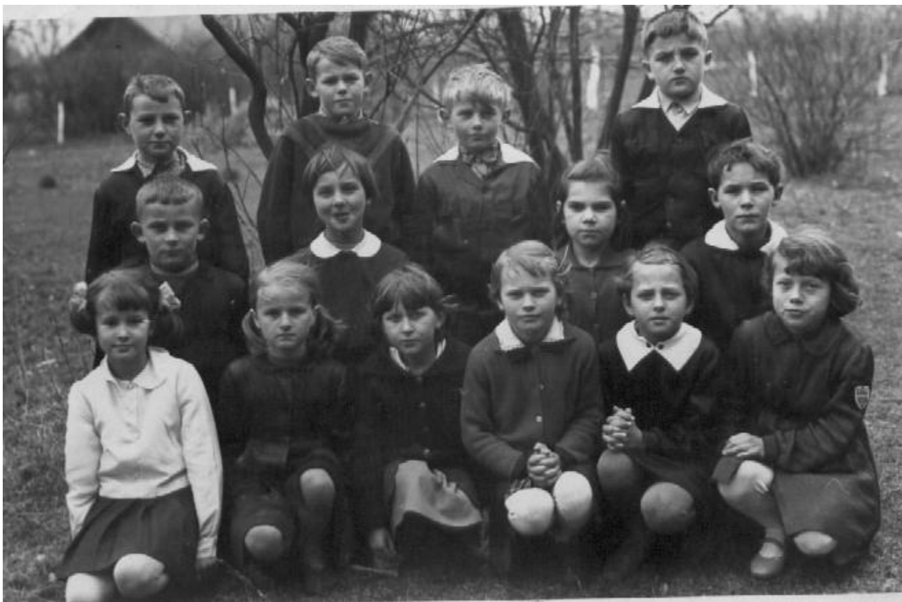
Klasa II w 1964 roku