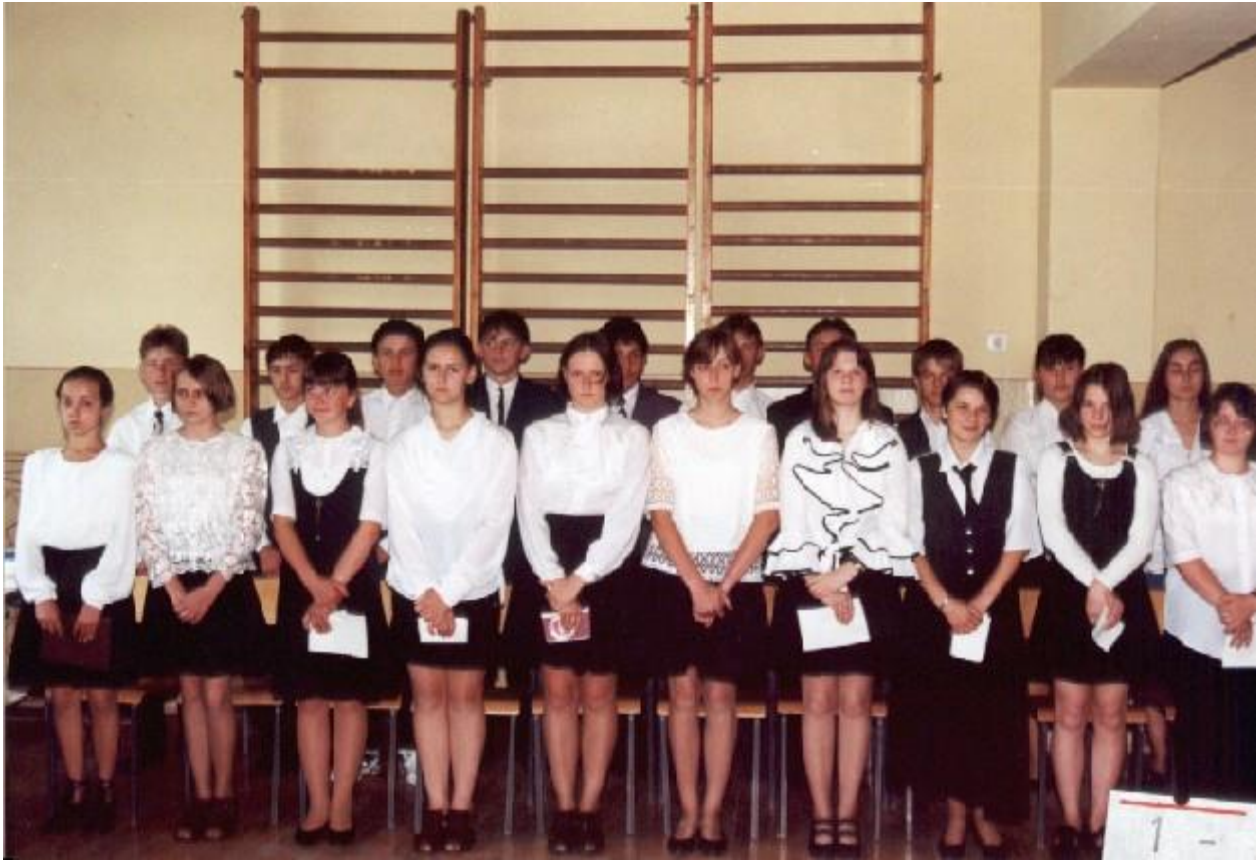
Pożegnanie szkoły przez ośmioklasistów, 1996 r.