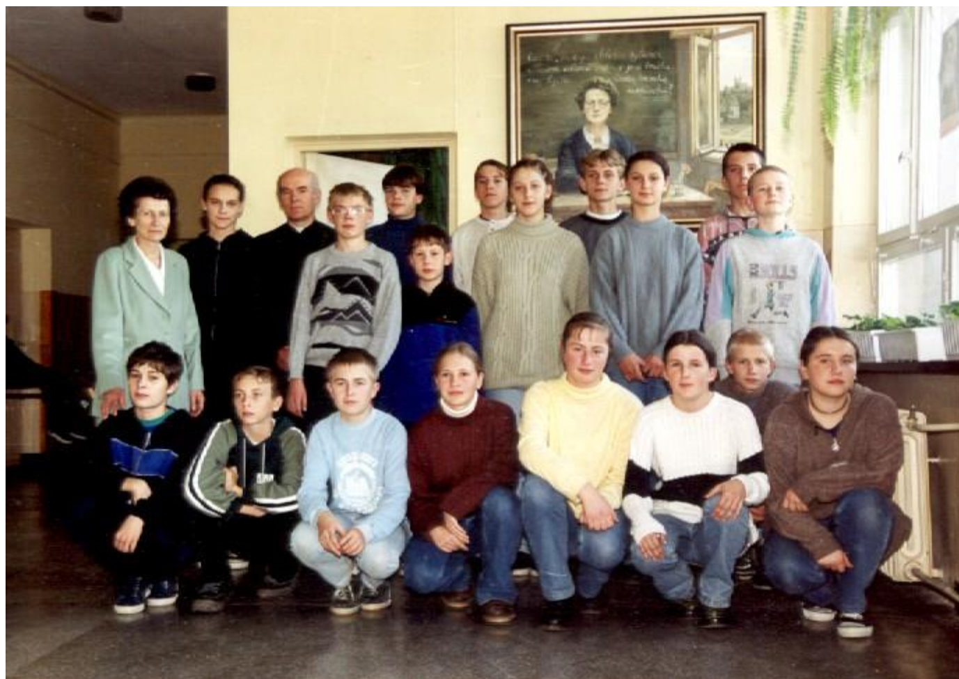
Ostatni rocznik klasy VIII rok szkolny 1999/2000