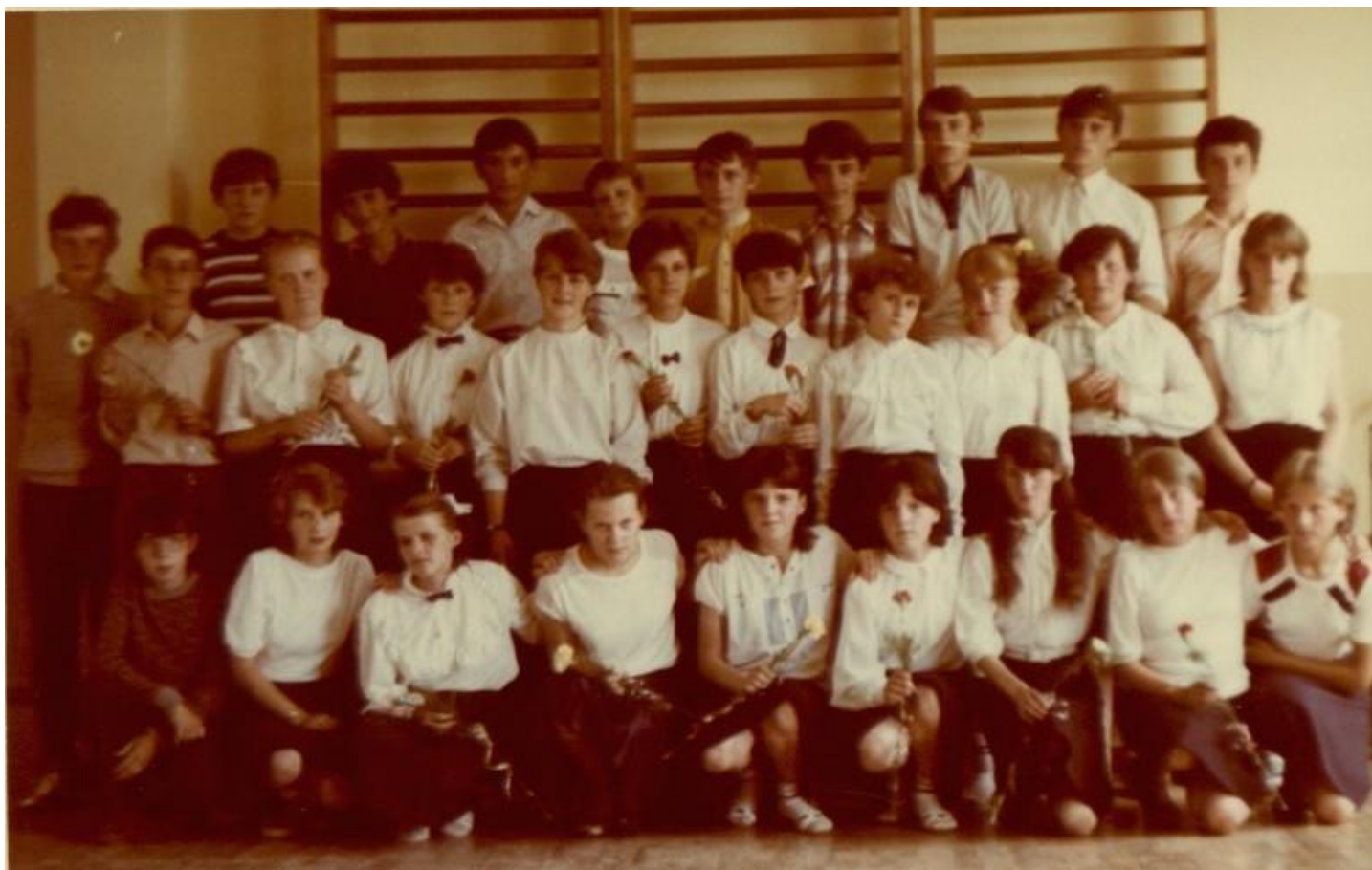
Pożegnanie szkoły przez uczniów klasy VIII, 1986 r.