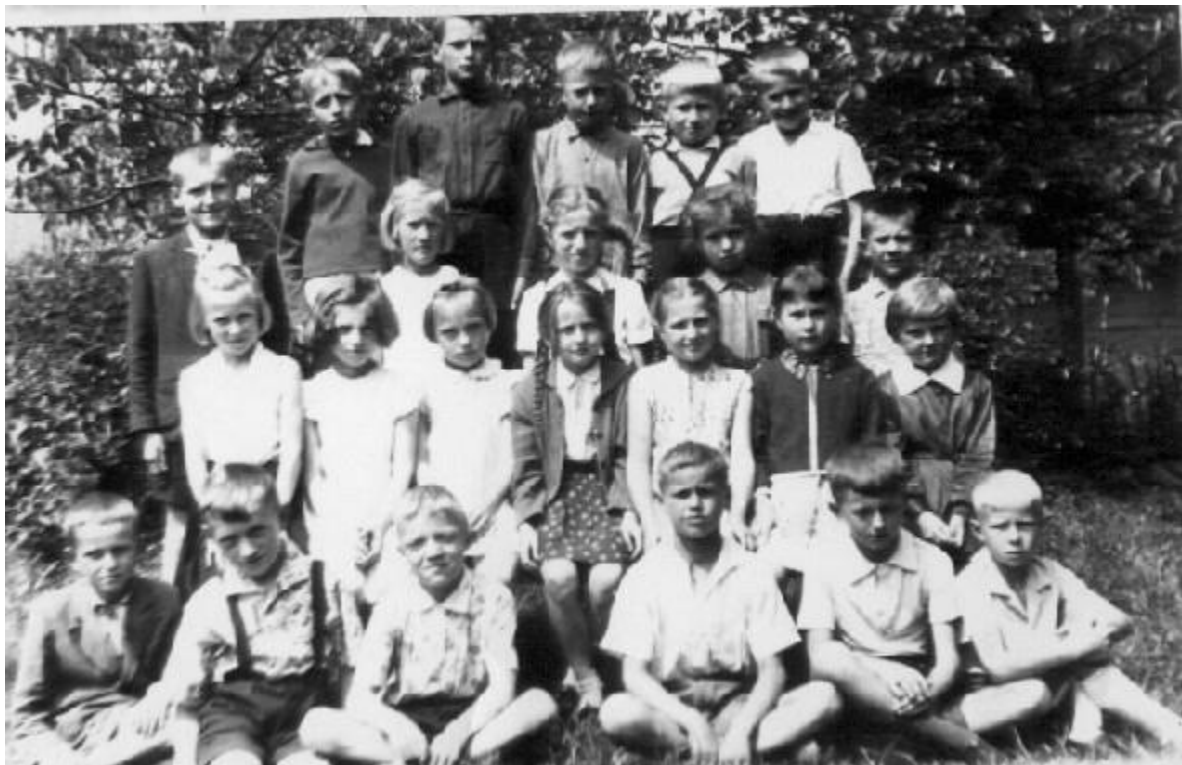
Klasa III Szkoły Podstawowej w 1962 roku