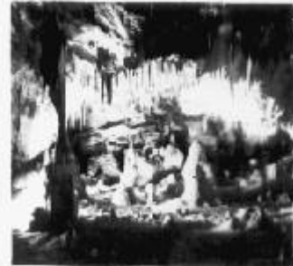
Wycieczka w Góry Świętokrzyskie w 1980 roku