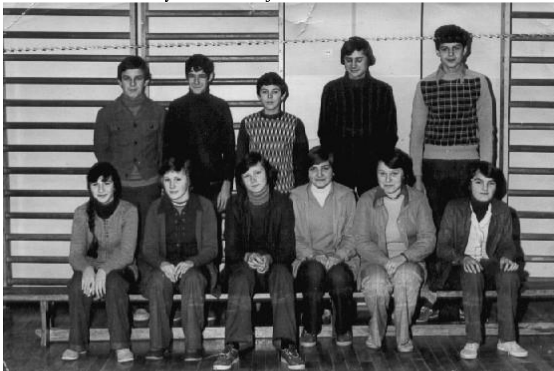
Klasa VIII w 1981 roku