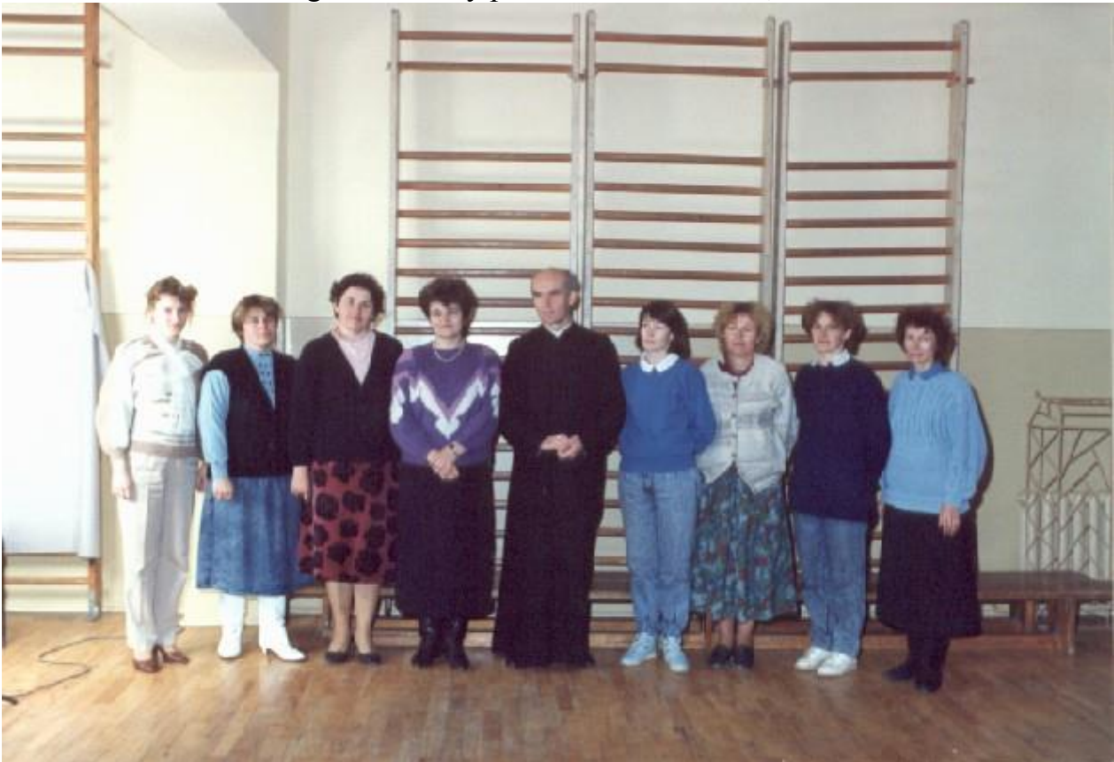
Grono Pedagogiczne, 1992 r.