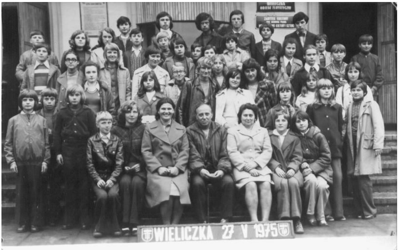
Wycieczka do Wieliczki w 1975 roku