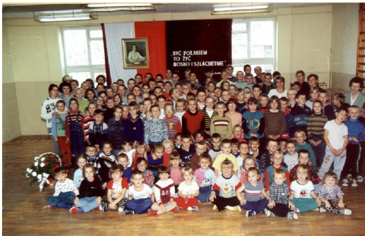
Uczniowie Zespołu Szkół w Rogóżnie po uroczystości nadania imienia rok szkolny 1999/2000