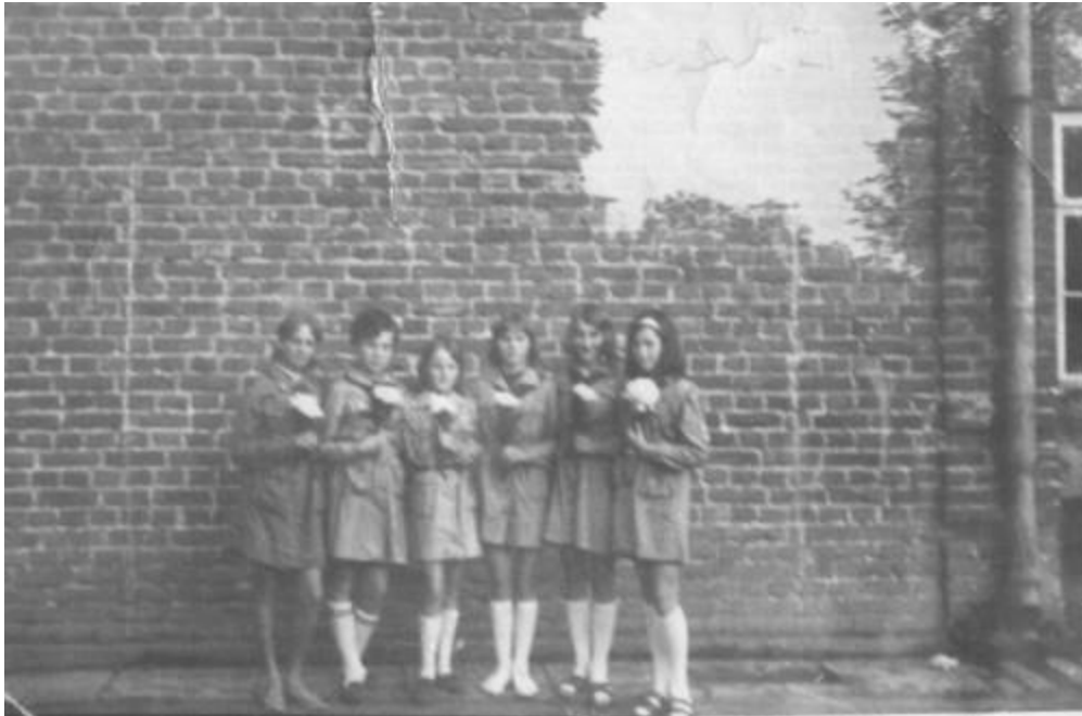
Zespół śpiewaczy "Elżbietki" w 1969 roku