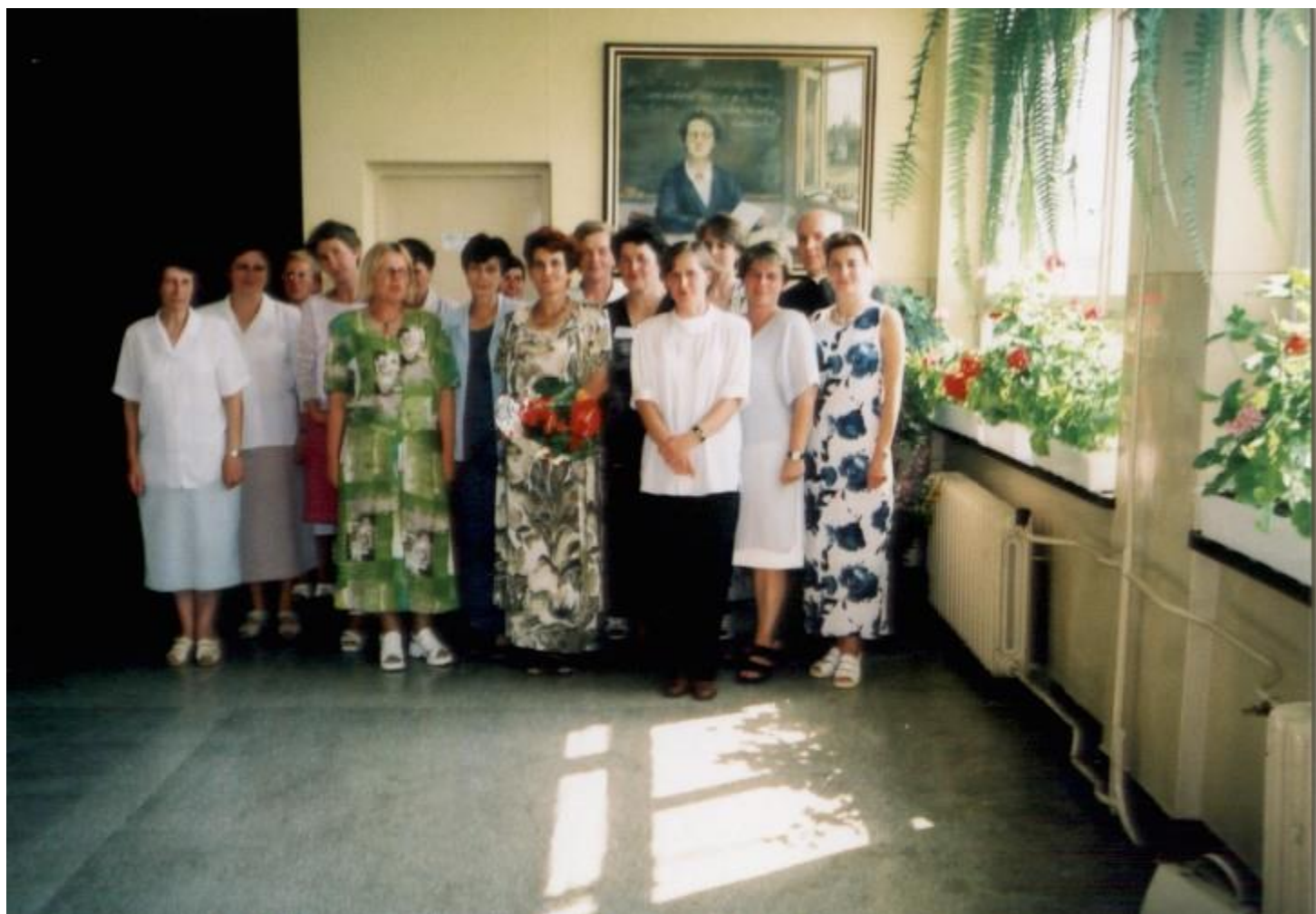
Pożegnanie Nauczycieli-Seniorów, 20 VI 2000 r.