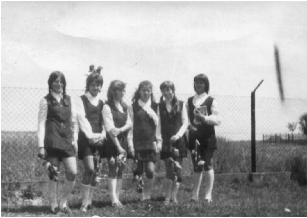
Pożegnanie klasy VIII w 1972 roku